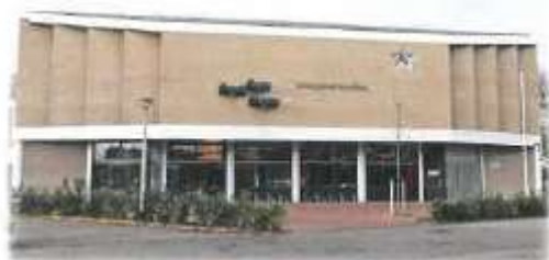
Hervormde Morgenstergemeente te Zoetermeer College van Kerkrentmeesters - Begroting 2019